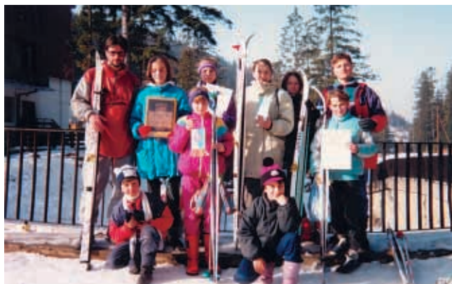
Po zawodach narciarskich

Do walki o puchar 10-lecia UKS „Victoria“ oprócz gospodarzy stanęły drużyny: UKS „Czarni“ (Skomielna Czarna), UKS „Jedynka“ (Tokarnia) oraz UKS „Cyrhla“ (Krzczonów). Pierwszą konkurencją była piłka nożna mieszana (dziewczeta z powodzeniem rywalizowały ze swoimi kolegami). Najlepszym zespołem okazali się „Czarni“. Podobnie było w konkursie żon-