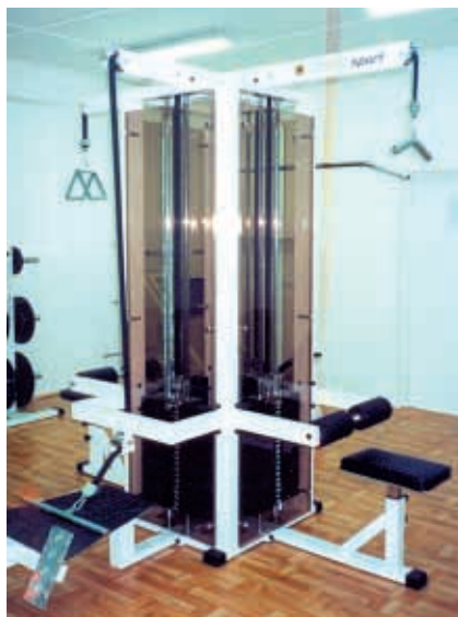
Sprzęt do siłowni