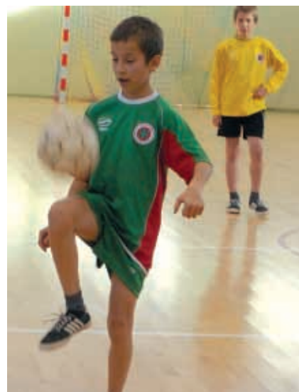
Zawody o Puchar 10-lecia UKS „Victoria“