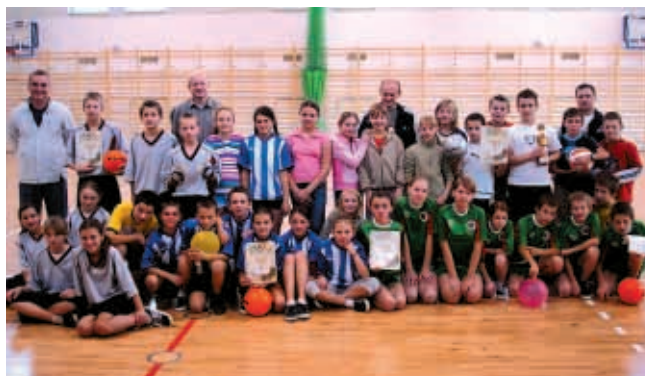
Zawody o Puchar 10-lecia UKS „Victoria“