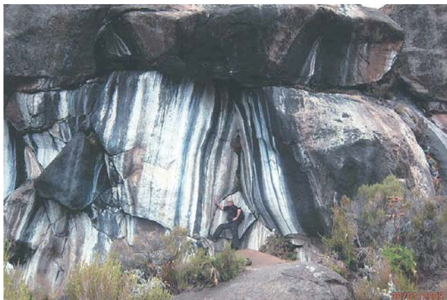
Pasiaste głazy wulkaniczne przy trasie na Przełęcz Mawenzi.

trzeszczącego piachu żuźlowego pod butami. Dla niektórych przejście tylu kilometrów takich warunkach, daje znać o sobie. Zakwaszone mięśnie wymagają krótkich ale częstych przystanków oraz wolnego marszu. Przewodnicy dali nam możliwość doboru tempa do swoich możliwości, więc grupa rozciągnęła chyba z kilometr. Mocniejsi dali wyraz swych możliwości i grubo przed wieczoremeszli do Horombo. Tu w obozie na 3720 m, dotleniamy się i znowu oddychamy swobodnie. Żartujemy nawet z najmniej przyjemnych szczytowych doznań. Pozwalamy sobie na zakup piwa o nazwie „Kilimandżaro” za cztery dolary za butelkę. Na składane gratulacje od tych zamierzają wyjść na górę, mówimy Hakuna matata (w suahili- „nie ma sprawy”). Czas na podziękowania dla całej ekipy obsługi. Wręczamy należne im napiwki i co najważniejsze robimy z nimi wspólne pamiątkowe zdjęcia. Kucharze przygotowali obfitą kolację po której szybko kładziemy się do śpiworów by odespać zaległość. Rano budzimy się wypoczęci, wyspani i gotowi do dalszej drogi. Dzień zapowiada się słoneczny, bezchmurny i po śniadaniu wyruszamy. Jest to ostatni ale bardzo