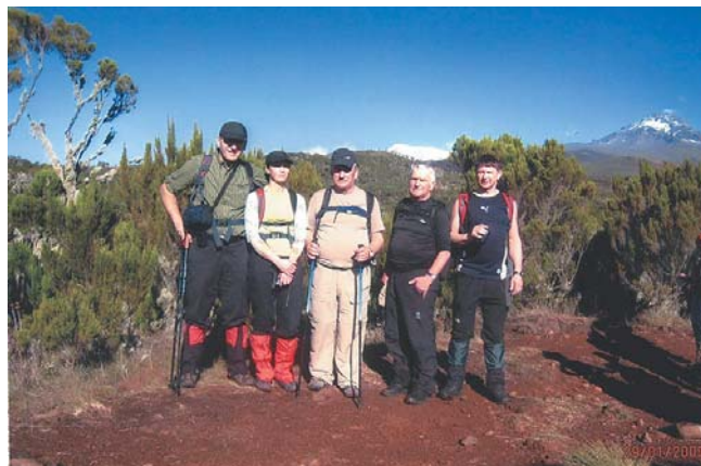
W połowie trasy na Kilimandżaro, w głębi lodowiec, po prawej stronie szczyt MAWENZII

kolorowych kwiatów, wrzosów drzewiastych. Rozprężony ze stresu umysł, teraz właściwie wchłania w pamięć, piękno wysokogórskiej sawanny oraz tropikalnego, deszczowego lasu. Będzie co wspominać a robione zdjęcia otworzą wspaniałości afrykańskiej flory. Dochodzimy do bram parku, wysyłamy pocztówki do znajomych i tu jeszcze raz główny przewodnik składa nam gratulacje z okazji wejścia na Kibo i wręcza piękne certyfikaty ze zdobycia Uhuru Peak. Koniec wyprawy, wracamy na noc do Arushi.