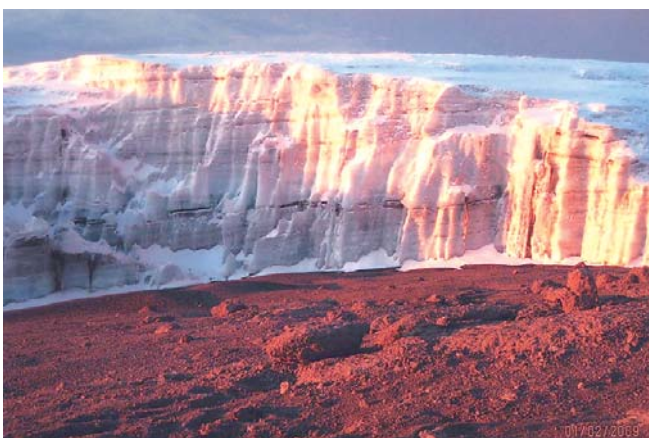
Lodowiec na Kilimandżaro przy wschodzie słońca

ią krateru dzielimy się na dwie grupy. Część grupy wymaga dłuższego wypoczynku. My po 5- ciu godzinach docieramy jeszcze o zmroku na Gilmans Point. Dla wielu osób psychicznie najtrudniejszy jest ostatni odcinek do głównego wierzchołka położonego o 220 m wyżej i co najmniej jedną godzinę marszu. Chwilą odpoczynku na głazach, bo w głowie się kręci, kilka łyków herbaty i z trudem się podnosimy i kroczyliśmy za kroczeniem