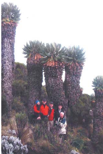
Kaktusy-Lobelle przy obozie na wysokości 3700m n.p.m.

ią krateru dzielimy się na dwie grupy. Część grupy wymaga dłuższego wypoczynku. My po 5- ciu godzinach docieramy jeszcze o zmroku na Gilmans Point. Dla wielu osób psychicznie najtrudniejszy jest ostatni odcinek do głównego wierzchołka położonego o 220 m wyżej i co najmniej jedną godzinę marszu. Chwilą odpoczynku na głazach, bo w głowie się kręci, kilka łyków herbaty i z trudem się podnosimy i kroczyliśmy za kroczeniem