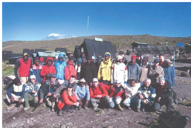
Zdjęcie zbiorowe uczestników z obsługą w obozie pod szczytem w drodze powrotnej