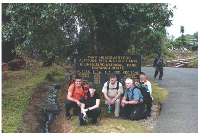
Przy bramie do wejścia Parku Kilimandżaro

długi odcinek trasy z Horombo do bram parku, prawie 30 kilometrów z odpoczynkiem Handara hut. W drodze powtórnie podziwiamy mięsiste senecje i lobelie, niezliczone ilości