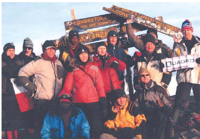
Uczestnicy wyprawy wraz z przewodnikiem na szczycie Kilimandżaro UHURU.jpg

długi odcinek trasy z Horombo do bram parku, prawie 30 kilometrów z odpoczynkiem Handara hut. W drodze powtórnie podziwiamy mięsiste senecje i lobelie, niezliczone ilości