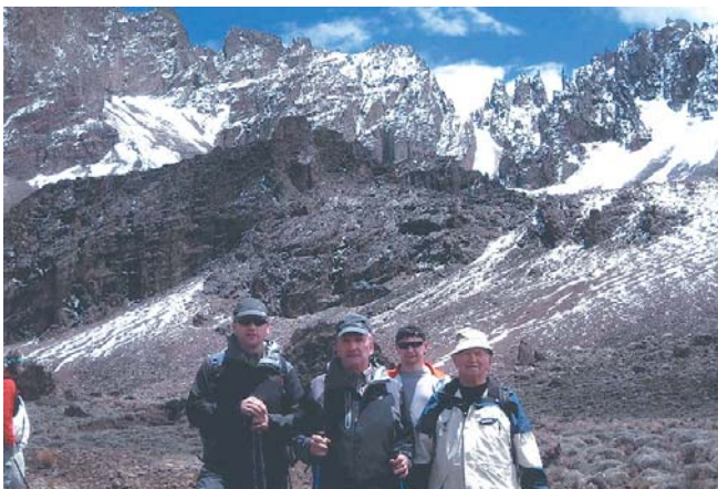
Niższy szczyt Kilimandżaro wysokość 5149 m n.p.m.