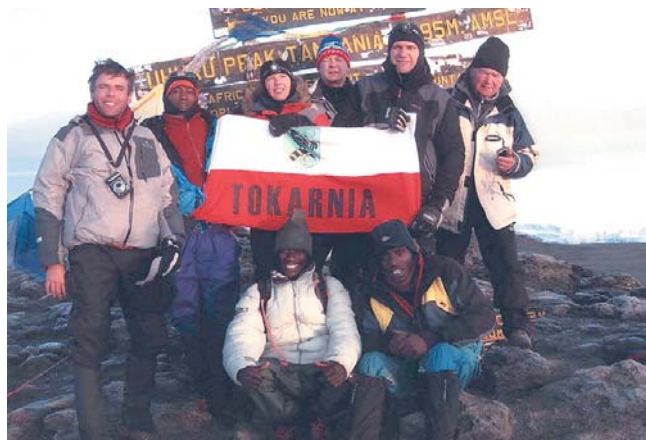
UHURU najwyższy szczyt Kilimandżaro zdobyte - mamy to o czym marzyliśmy

kolorowych kwiatów, wrzosów drzewiastych. Rozprężony ze stresu umysł, teraz właściwie wchłania w pamięć, piękno wysokogórskiej sawanny oraz tropikalnego, deszczowego lasu. Będzie co wspominać a robione zdjęcia otworzą wspaniałości afrykańskiej flory. Dochodzimy do bram parku, wysyłamy pocztówki do znajomych i tu jeszcze raz główny przewodnik składa nam gratulacje z okazji wejścia na Kibo i wręcza piękne certyfikaty ze zdobycia Uhuru Peak. Koniec wyprawy, wracamy na noc do Arushi.